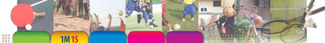
Jadual 6 : Cadangan Kaedah Pelaksanaan Dasar 1M 1S